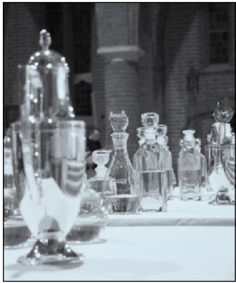
Een bijzondere viering is jaarlijks de Eucharistieviering op